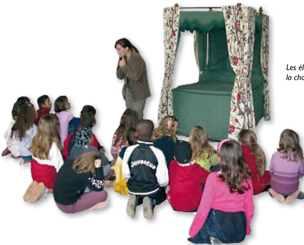
Les élèves découvrent la chambre de la Marquise