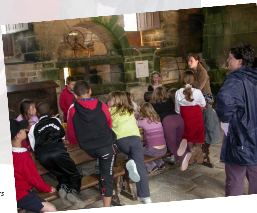
La cuisine et les saveurs d'autrefois